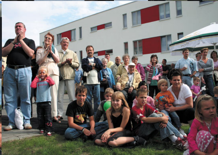
Grundsteinlegung, Richtfest, Einweihung – zum dritten Mal feierte die HWB mit den Bewohnern des Quartier D ein stimmungsvolles Fest