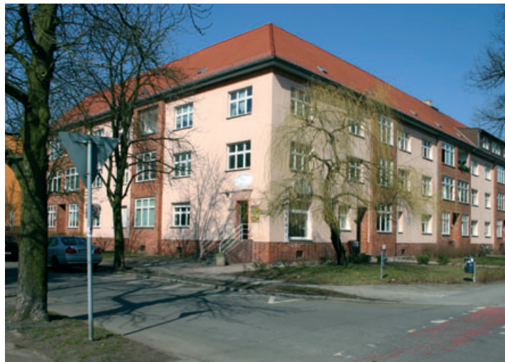
Investitionsschwerpunkt. In diesem Jahr beginnt die HWB mit den planerischen und organisatorischen Arbeiten für die kommendes Jahr geplante umfassende Modernisierung des Heizungssystems des „Himbeerblocks“.

Auch in diesem Jahr wird die HWB ihr 2008 aufgelegtes „1000-Euro-Programm“ zur Unterstützung von Mietern, die ihre Wohnung in Eigeninitiative seniorengerecht umbauen wollen, fortsetzen. Lassen Mieter beispielsweise ihr Wannenbad in ein barrierearmes, seniorengerechtes Duschbad umbauen, übernimmt die HWB 1000 Euro der anfallenden Kosten. Je nach Umfang der Bauarbeiten sind das 30 bis 40 Prozent der Gesamtkosten.