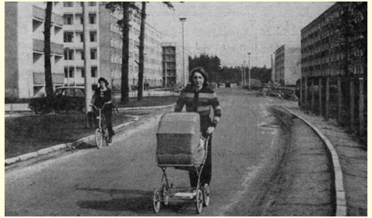
Neubaugebiet Hennigsdorf-Nord: Jung und modern! (Foto und Text aus „Hennigsdorfer Stahl“, Betriebszeitung des Stahl- und Walzwerkes vom 2. Juni 1977)

Mehr als Fassade. Nicht nur die „Mondrian-Fassade“, auch das „Innenleben“ der beiden Wohnblöcke Rigaer Straße 5/5a kann sich heute sehen lassen.