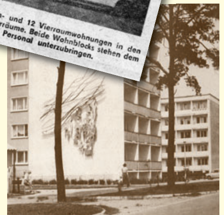
Wohngebiet Hennigsdorf Nord um 1980.