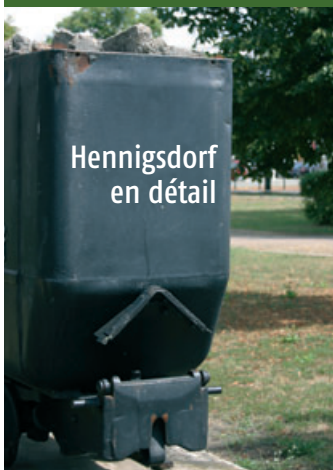
Hennigsdorf en détail

Vergessener Bauschutt oder Kunstobjekt? Wurde diese angejahrte Lore bei der letzten großen Bauaktion vielleicht vergessen? Wenn Sie uns verraten, wo diese Lore zu besichtigen ist und aus welchem Anlass sie dort „abgestellt“ wurde, haben Sie die Chance, 50 Euro zu gewinnen.