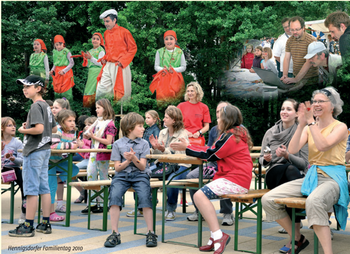
Hennigsdorfer Familientag 2010

Informationen für Mieter und Kunden der Hennigsdorfer Wohnungsbaugesellschaft mbH