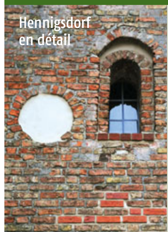
Hennigsdorf en détail

Altes Haus. Anderthalb Meter dicke Mauern und Schießscharten – das kleine Gotteshaus macht einen wahrhaft wehrhaften Eindruck. In unsicheren Zeiten bot es den Dorfbewohnern Zuflucht. Das aber ist schon eine ganze Weile her. Wenn Sie wissen, welches Gebäude auf dem Foto abgebildet ist, haben Sie gute Chancen, 50 Euro zu gewinnen.