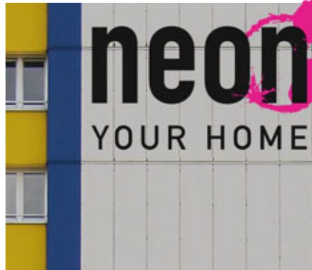
Wohnen mit Farbe. Unter dem Slogan „Neon your home“ wird das Hochhaus Stauffenbergstraße 13 für vorwiegend jüngere Mieter umgestaltet.

Vogel, die für das Projekt verantwortliche HWB-Mitarbeiterin. Zurzeit werden drei Einraumwohnungen als Musterwohnungen hergerichtet. „Unterschiede gibt es vor allem im Bad und in der Küche“, erklärt Anja Vogel. Das Bad für die junge Zielgruppe wird in Weiß und Orange, das für die Senioren in mediterranen Tönen gefliest. Die geplanten Einbauküchen sind in der „jungen Variante“ Anthrazit. Für die Zielgruppe der älteren Mieter hat die HWB sich für ein elegantes Magnolienweiß entschieden. Nicht nur bei der Farbe, auch bei der Ausstattung gibt es Unterschiede. So sind beispielsweise die Seniorenbäder mit erhöhten Toiletten ausgestattet. „Wenn die Einbauküchen da sind, können wir die Musterwohnungen wahrscheinlich Mitte Januar präsentieren“, sagt Anja Vogel. ◀