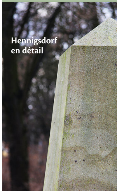
Hennigsdorf en détail

Meilenstein. Als die preußische Post Briefe und Menschen noch per Kutsche beförderte, führte eine der wichtigsten Verbindungen der damaligen Zeit, die Alte Hamburger Poststraße, durch Hennigsdorf. Postmeilensteine säumten die Straße und gaben die Entfernung an. Wenn Sie uns sagen können, wo die Nachbildung des Hennigsdorfer Steines steht und wie viele Meilen es von dort nach Berlin einst waren, haben Sie die Chance, 50 Euro zu gewinnen.