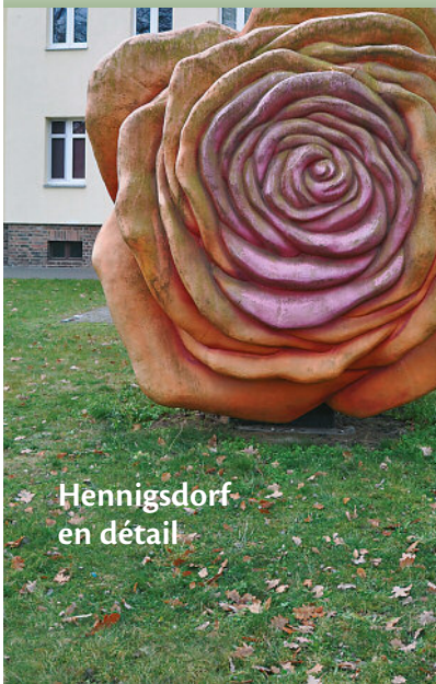
Hennigsdorf en détail

Kunstblume. Aus der Sebnitzer Manufaktur kommt diese riesige Rose ganz sicher nicht. Bevor sie ihren Weg nach Hennigsdorf auf eine Rasenfläche an der Clara-Schabbel-Straße fand, steckte sie in einem großen „Geburtstagsstrauß“ für einen weltberühmten Platz im Herzen Berlins. Wenn Sie wissen, für welchen Berliner Platz der Künstler Sergej Dott den „Geburtstagsstrauß“ ursprünglich „gebunden“ hatte, haben Sie die Chance, 50 Euro zu gewinnen.