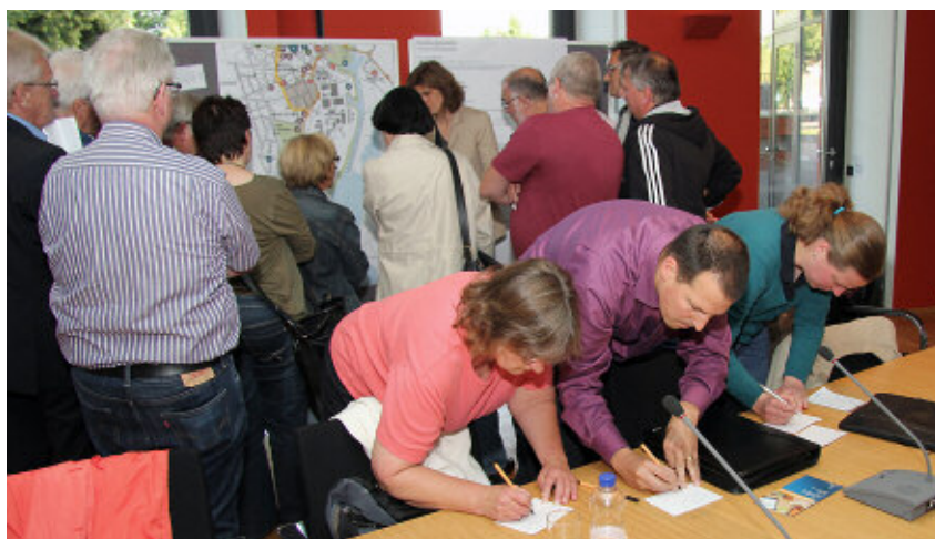
Zettelwirtschaft. Die Teilnehmer der Bürgerwerkstatt hatten viel zu sagen. Nach einer Stunde intensiver Diskussion waren die Pläne mit etlichen „Wunschzetteln“ gespickt.

In drei Arbeitsgruppen sammelten die Bürger zahlreiche Vorschläge, Konkretisierungen und Einwände zu den vorliegenden INSEK-Plänen: Tempo 30 oder Tempo 50, mehr altersgerechte Wohnungen, Tütenspender für Hundekot, mehr Fußgängerüberwege an Hauptverkehrsstraßen, Verkürzung der Taktfolge des 136er Busses, Natur-