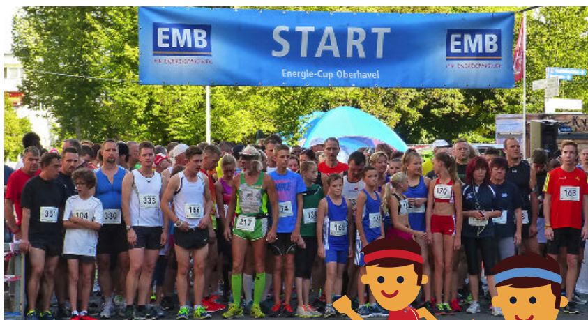
Gleich geht's los. Start zum Citylauf 2015