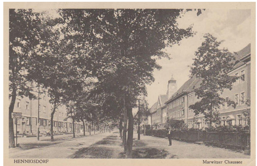
Grüße aus der Stahlwerkerchaussee. Ansichtskarte um 1930 von der erst wenige Jahre alten Werksiedlung an der Marwitzer Chaussee – der heutigen Marwitzer Straße.

Wegen „polizeiwidriger und gesundheitsschädlicher“ Wohnbedingungen mussten 1938 die Baracken an der Seilerstraße gesperrt und schließlich abgerissen werden. An deren Stelle errichtete das Stahlwerk ab 1939 vier Blöcke mit über 100 Wohnungen. Nach dem Ende des zweiten Weltkrieges, der Enteignung und Demontage