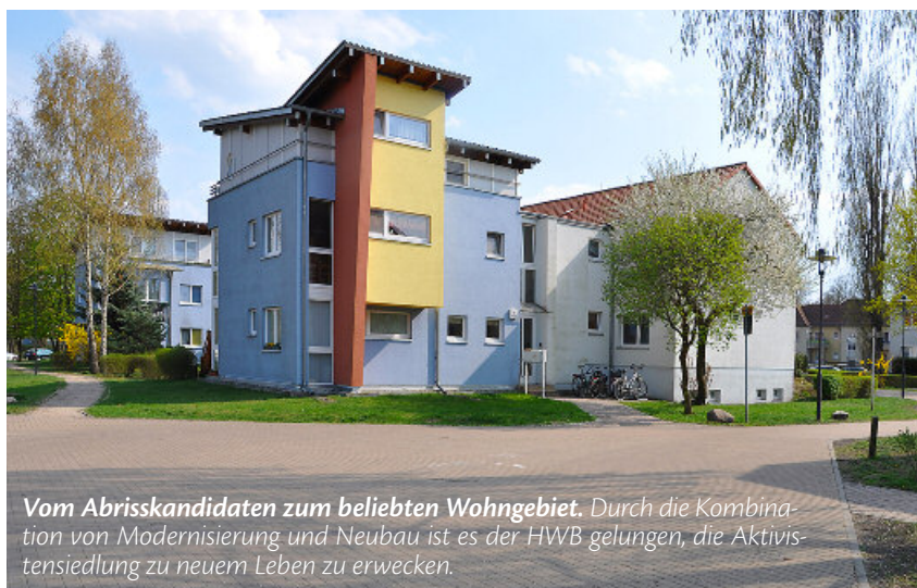
Vom Abrisskandidaten zum beliebten Wohngebiet. Durch die Kombination von Modernisierung und Neubau ist es der HWB gelungen, die Aktivistensiedlung zu neuem Leben zu erwecken.

Im Sommer 1993 trafen die HWB und die Stadt eine für das Unternehmen